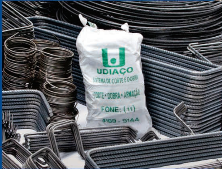
Corte e Dobra