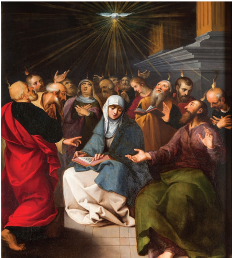
Pintura da cena de Pentecostes na catedral da Antuérpia, Bélgica

P rezados irmãos leitores, a Paz do Senhor esteja com todos! Estamos prestes a celebrar o grande dia de Pentecostes, o dia glorioso que a Igreja comemora a vinda do Espírito Santo sobre a Sma. Virgem Maria e sobre os Apóstolos, que por Jesus havia sido prometido. Este grandioso Dom que naquele dia foi derramado sobre a Igreja nascente, chega aos nossos corações, nos possibilitando hoje continuar a nossa caminhada iluminados por este mesmo Espírito que nos mantém firmes na Fé. Neste mês de Março temos a grande alegria de celebrarmos na liturgia da Igreja a